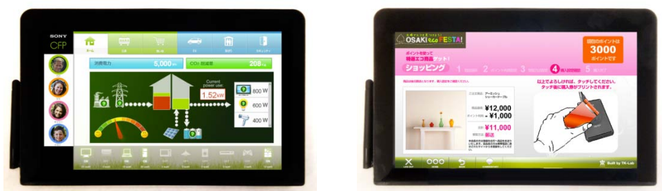
IC CARD WORLD 2011 ソニーブースにて参考出品

尚、試作品を2011年3月8日から開催される「IC CARD WORLD 2011」ソニーブースにて、参考出展致します。